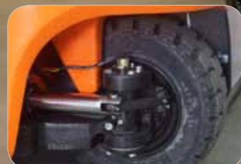
Optimale stuurhoek om de draaicirkel zo klein mogelijk te houden.