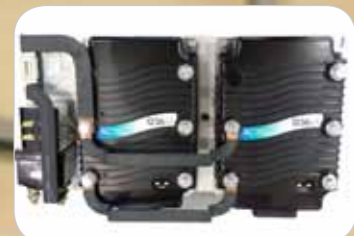
Betrouwbare, stabiele Curtis Controller (conform IP65)

Wanneer de bestuurder de stoel verlaat, treedt automatisch de elektromagnetische parkeerrem in werking. Deze voorkomt dat de heftruck ongecontroleerd achteruitrolt op laadperrons of hellingen. Door de instelmogelijkheden op het LCD display optimaliseert de bestuurder de prestaties voor zijn specifieke toepassing. Het afgeronde contragewicht en de optimale 93° stuurhoek zorgen voor de hoogste productiviteit, zelfs in smalle gangen.