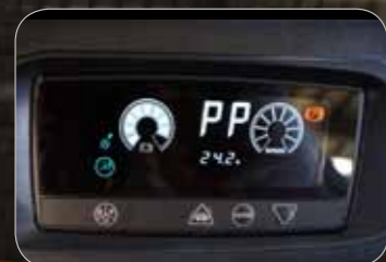
Gemakkelijk leesbaar LCD-display voor diagnose en prestatie-instellingen