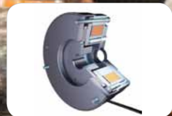
Speciaal ontwikkelde elektromagnetische handrem