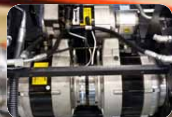
Eenvoudige, krachtige, gesloten aandrijf- en hydrauliekmotor (conform IP43)