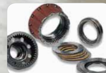
Nagenoeg onderhoudsvrije oliebadremmen

De 7-Series elektrische heftrucks zijn waterdicht en veilig voor buitengebruik. De nieuwe gesloten controllers zijn conform met de IP65 standaard en de gesloten motoren zijn conform IP43. De bedrading en connectoren zijn afgedicht met silicone. Dit betekent dat ze volledig beschermd zijn tegen stof, vuil en water, wat deze heftrucks geschikt maakt voor buitengebruik.