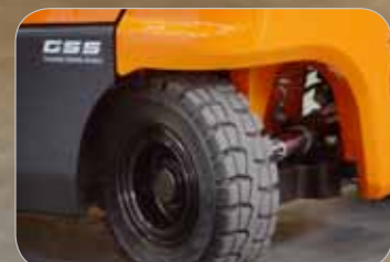
Comfortabel bewegen, dankzij het afgeronde contragewicht.